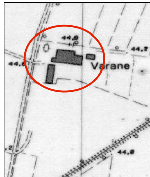
CTR (1:5.000) elem. n. 200022

via Montenero 10 località denominazione Varane