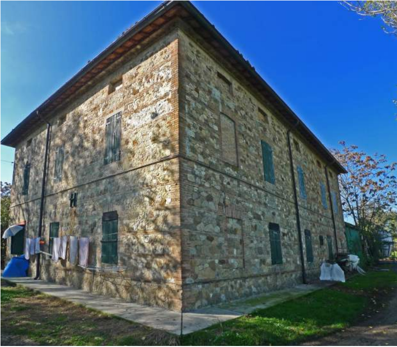
2012 (W. Colli – D. Palmia)