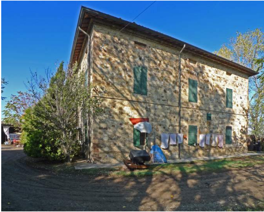
2012 (W. Colli – D. Palmia)