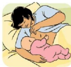
2 - Posizione sdraiata