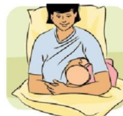
3 - Posizione "a rugby"