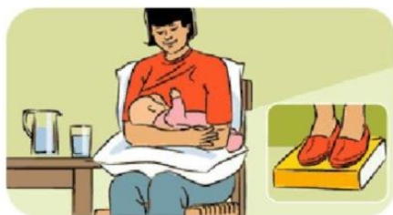
1 - Posizione incrociata